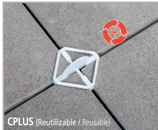
CPLUS (Reutilizable / Reusable)